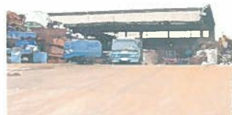
施設正面&メインタッパ 4.9tonリフマグ天井クレーン