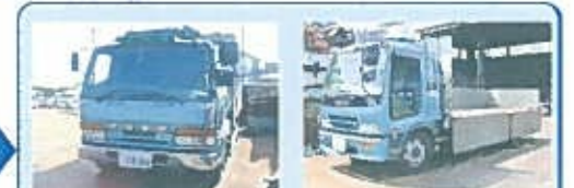
8ton平ボディ増頓仕様 (2台)

産業廃棄物収集運搬業 福島県 第0712056478号 仙台市 第5402056478号 郡山市 第8702056478号 栃木県 第0900056478号 いわき市 第9400056478号 宇都宮市 第8400056478号